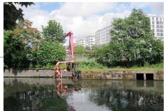
Mulig inngang av pipeline i Nizhny Novgorod