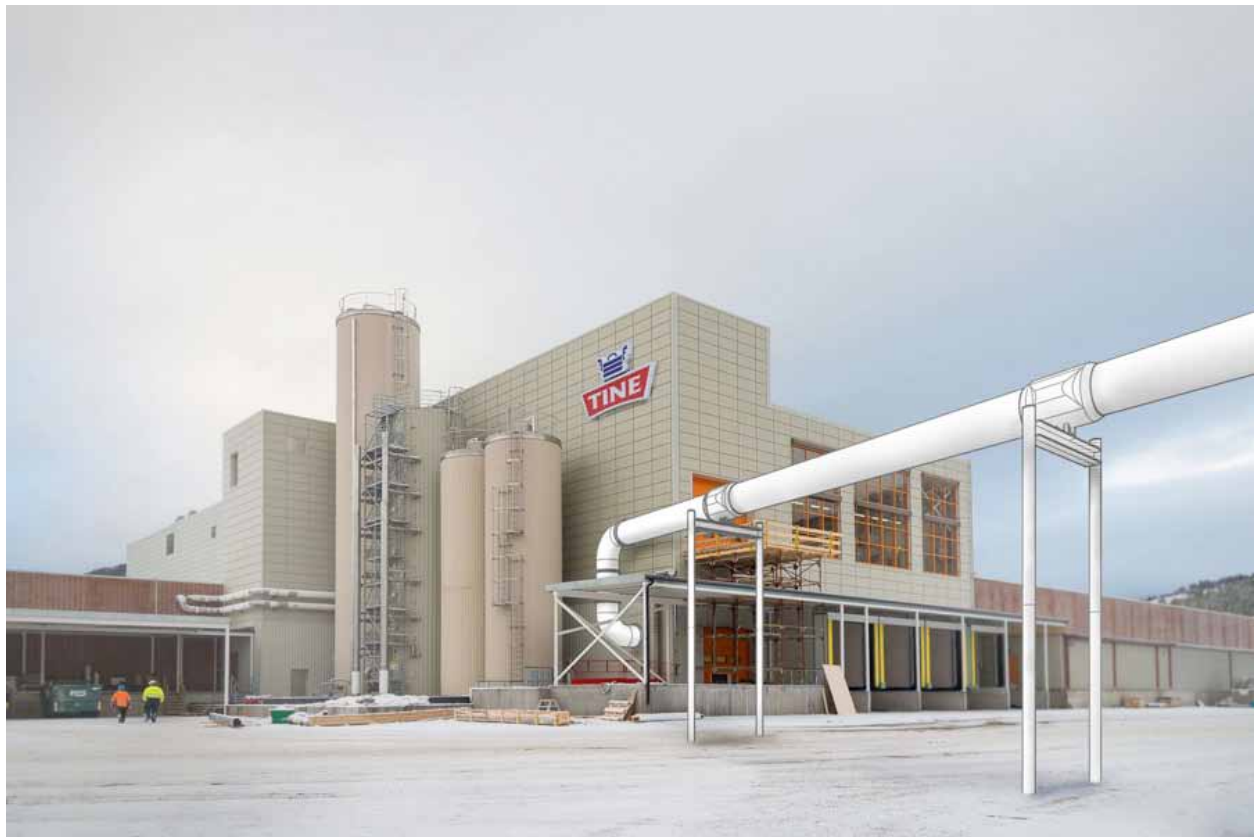
Installasjon 1. En pipeline installert ved Tine meierifabrikk i Sola (og Tana hvis vi har nok penger, frakten til Tana blir dyr men vi har tillatelse fra Tine å bygge ved begge fabrikker)