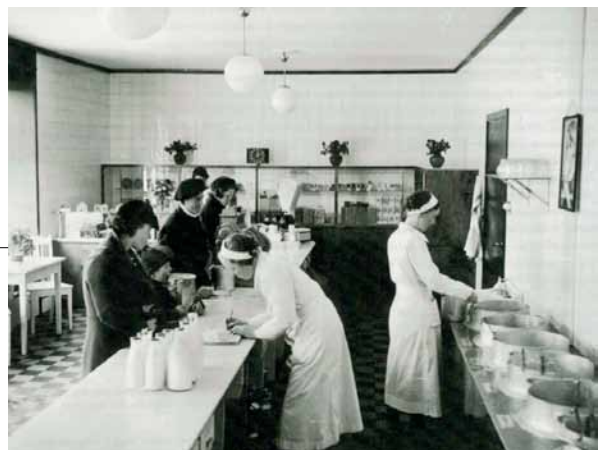
En melkebutikk i Norge på 1930-talet

Vår prioritet vil være internasjonal premiere på CPH: DOX i 2018, som er en attraktiv festival for denne filmen både for dens hybride format og dens aktive relasjon til kunstverden. Vi vil forhandle med VGtv, Aftenposten TV og NRK om visningsrett til filmen.