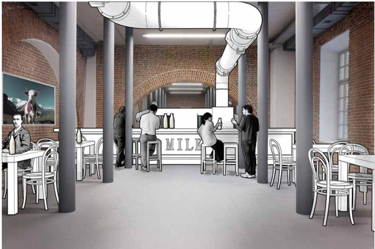
Installasjon 4. Melkebaren inne i museet, The National Center for Contemporary Art