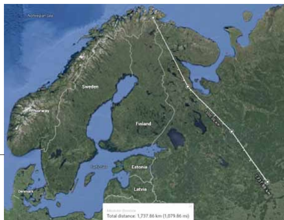
Det fiktive 2000 km lange rørets vei gjennom Russland

En hybrid-film av Egil Håskjold Larsen, produsert av Stray Dog Productions.