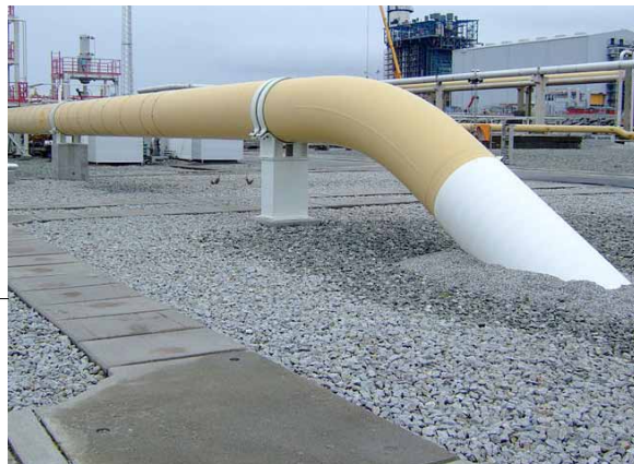
Røret går ned i bakke