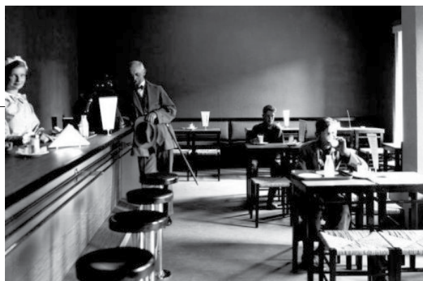
En melkebar i Sverige på 1930-talet