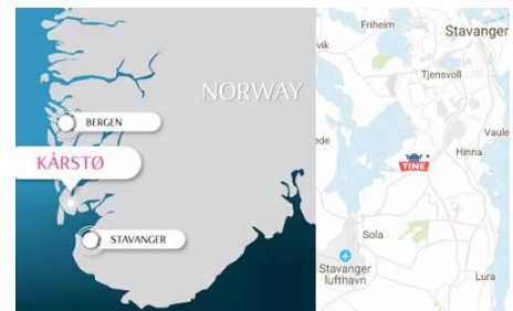
Røren fraktes fra Kårstø prosessanlegg av Bring Oljeekspressen