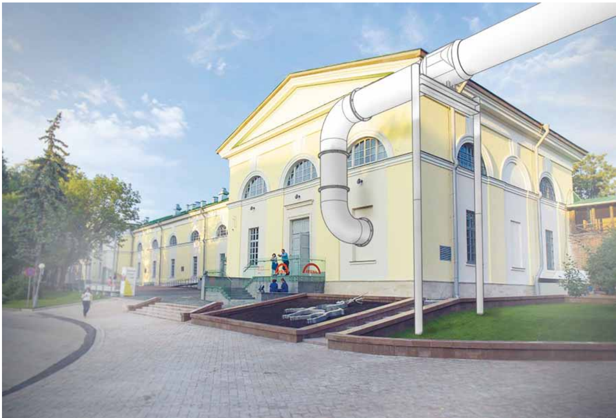
Installasjon 3. Røret ender i Nizhny Novgorod, Russland

selv, er rørledningen vår røde tråd. I dens umiddelbare periferi finner vi filmens historie, som kunstprosjektets forlengede arm. En del av røret er plassert i et øde og, om ikke annet værmessig, ugjestmildt nordnorsk sommerlandskap, med to over-karismatiske kunstnerspirer, melke-arbeidere, en rørlegger, rullings, gravemaskiner, og diverse skranglete forbipasserende skikkelser i rollene som seg selv. Alt ligger an til et drama, noe filmen suger seg fast i.