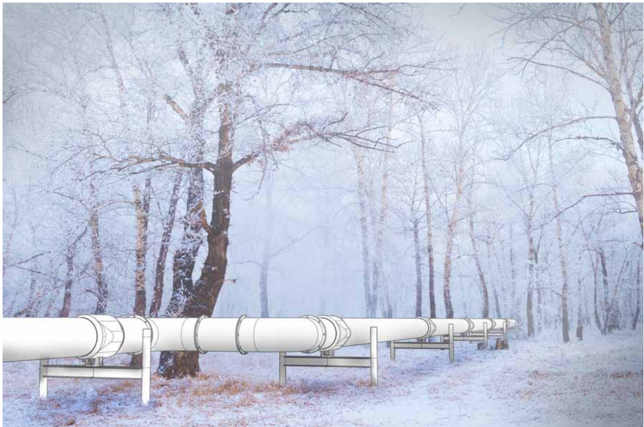
Installasjon 2. En pipeline gjennom skogen (Storskog ved grensen til Russland)